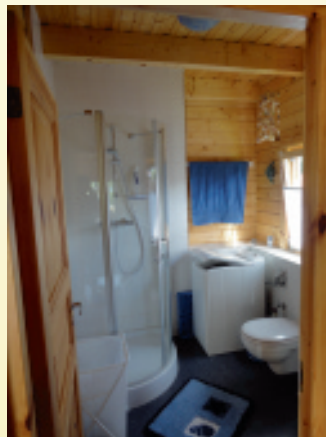
Bad mit Dusche, WC und Waschmaschine